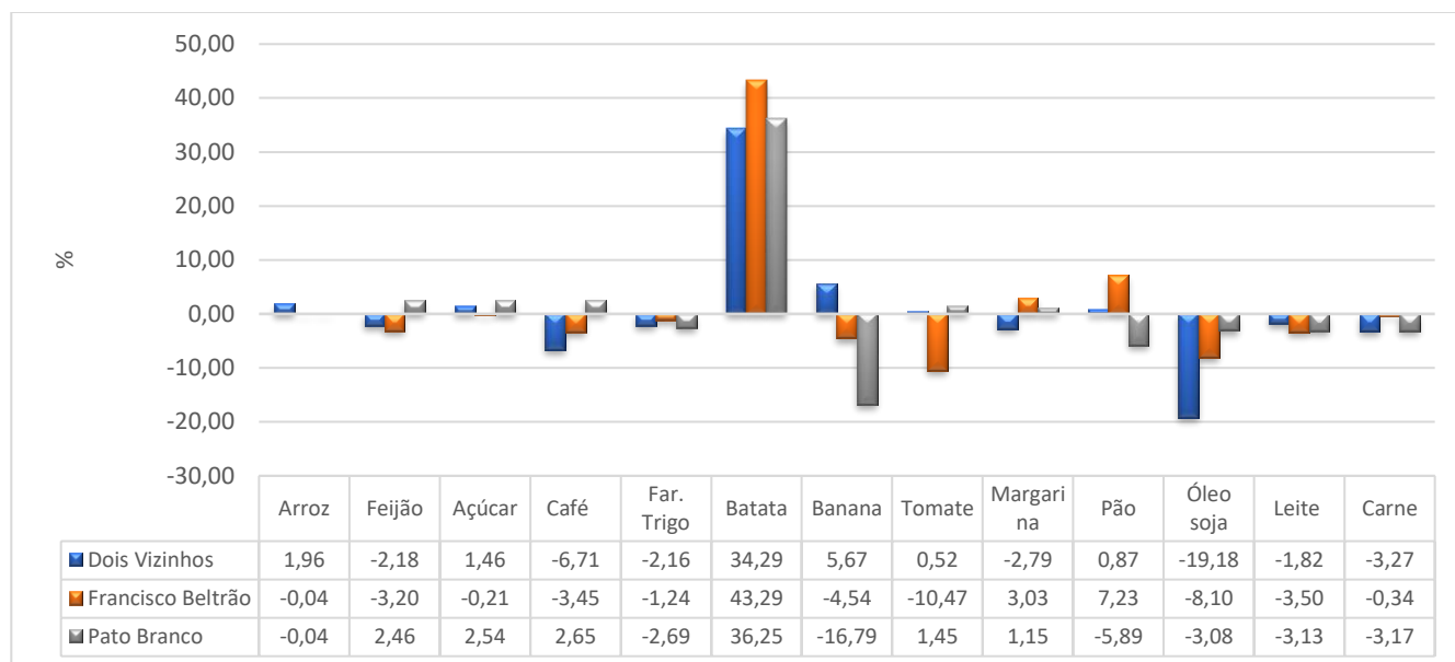
Gráfico 01 - Variação % mensal dos preços dos itens da Cesta Básica - Dois Vizinhos, Francisco Beltrão e Pato Branco – junho/2023.

básica referentes a junho de 2023 podem ser observados nos gráficos 01 e 02, na sequência.